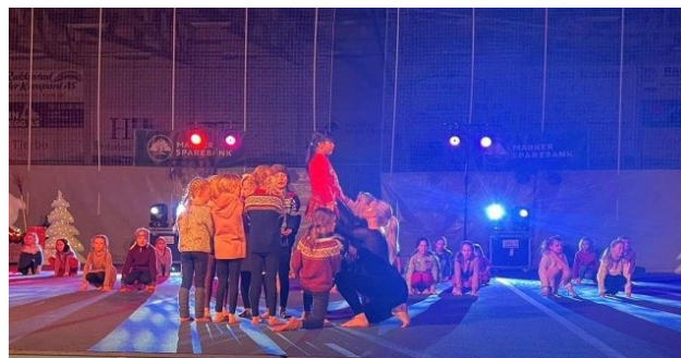
Fra juleoppvisninga 3. desember.

Da vi er så heldige å ha opplevd stor pågang på flere av våre trampettpartier, ble det drøftet hvordan vi best mulig skulle kunne gi turnerne våre et best mulig tilbud. Det ble bestemt å dele trampettpartiene opp i enda flere partier fra våren 2024.