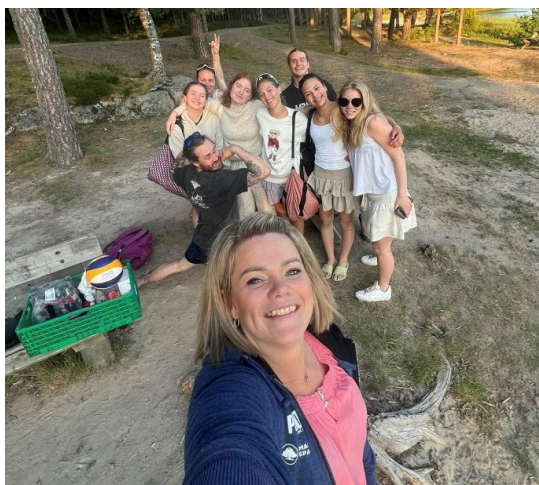
Ny leder, med trenere som koser seg i sommerværet.

6. juni ble det arrangert sommeravslutning for instruktørene. De koste seg med pizza, bading og sandvolleyball ved Kølvika i nydelig sommervær.