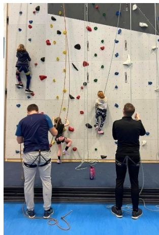
Klatreveggen var populær på turndøgnet

Mange var flinke til å stille opp for turngruppa i borgertoget 17. mai, og jaggu vant vi pokalen for beste innslag i toget.