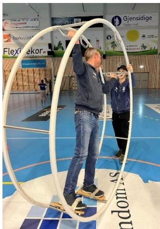
Avtroppende leder hjalp til på kvelden på turndøgn, og synes gymhjul var artig å teste ut.

25. - 26. mars gjennomførte "gammelt og nytt styre" turndøgn. Det var ca.140 deltakende, inkludert instruktører. Vi gjennomførte aktiviteter som boblefotball, klatrevegg, dans, trampett/trampoline, gymhjul og crossfit. Vi sendte hjem mange slitne, men glade barn søndag formiddag, og gleder oss allerede til turndøgn i 2024.